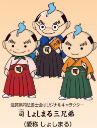
滋賀県司法書士会オリジナルキャラクター 司 しまる三兄弟 (愛称 しまる)